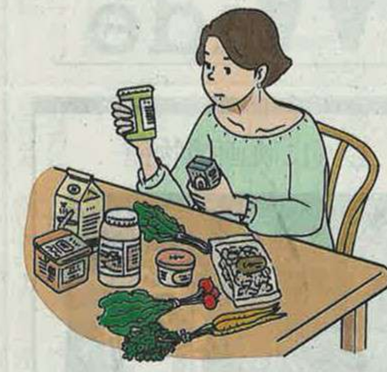
健康的な食事に不健康なまでに執着してしまう

「今まで体に悪いと思っていた食べ物でも、少しくらいなら大丈夫と思えるようになり、食べられる物が増えていきます。健康志向をゼロにするのではなく、困らない程度までハードルを下げる