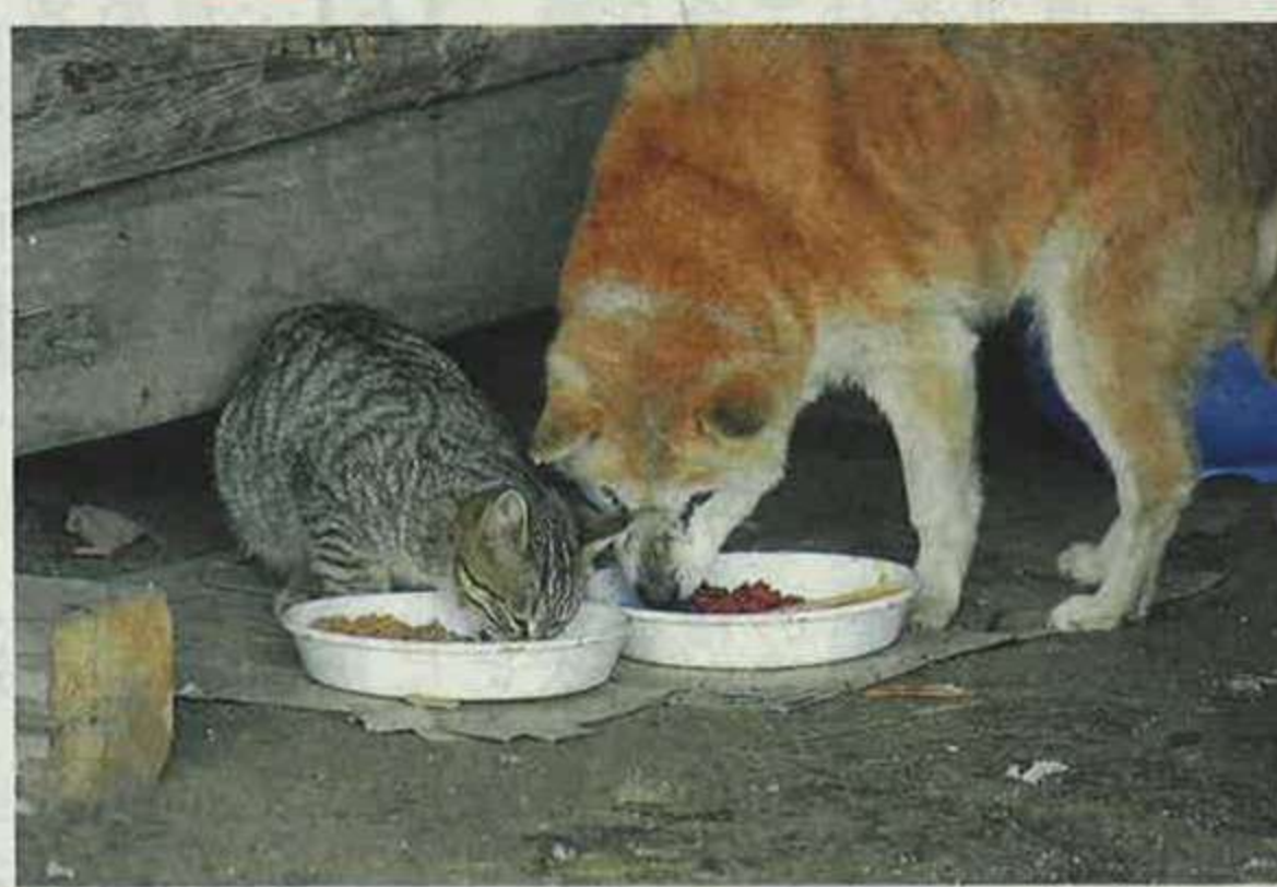
被災地のペットたち 給餌活動から見えたもの 日比輝雄