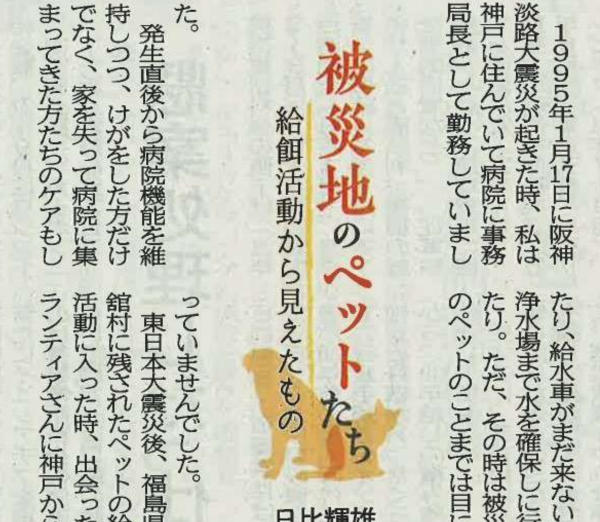
被災地のペットたち 給餌活動から見えたもの 日比輝雄